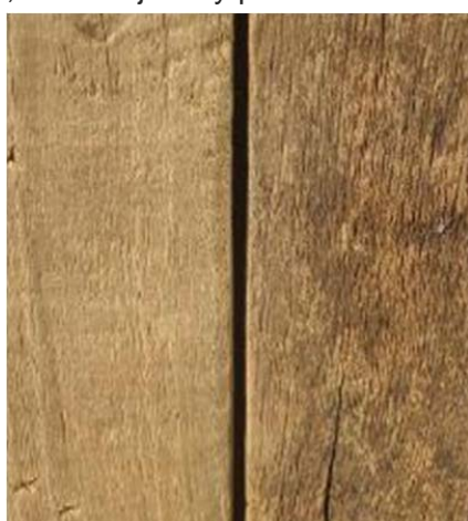
Madera sin barnizar lavada y sin lavar