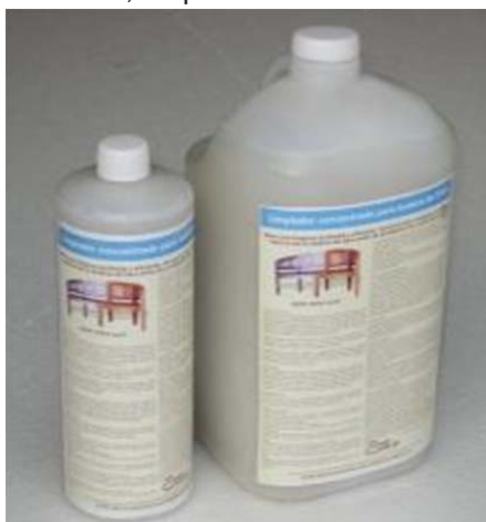
Presentación de 1 y 4 litros

A diferencia otros jabones y detergente este limpiador separa y suspende la suciedad, limpiando mejor que otros! Usted mismo lo comprobara! Puede utilizarlo para limpiar madera sin barnizar antes de teñirla, pintarla o aceitarla, limpiar madera barnizada, otros objetos y pisos.