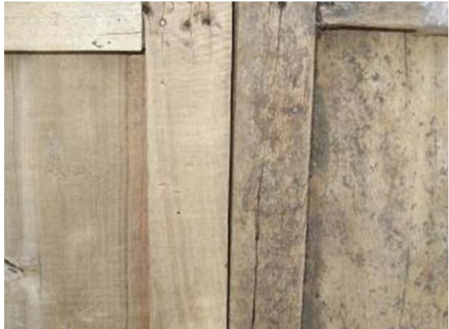
Lavado con limpiador y antes de limpiar