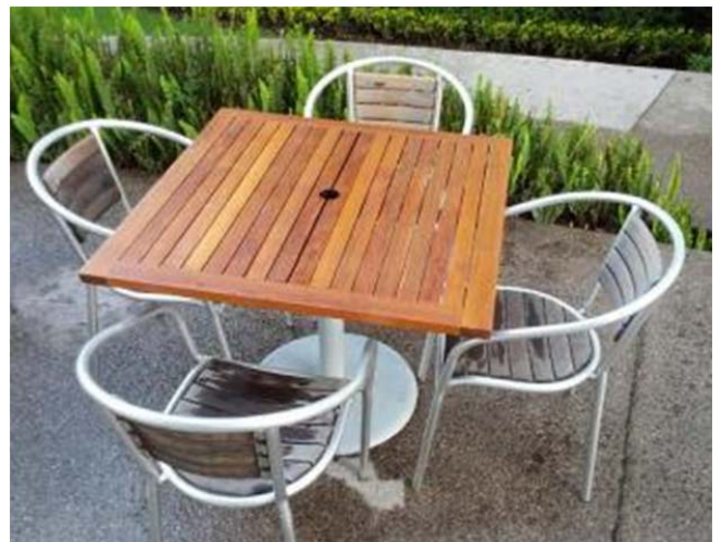
Después de usar el Kit en la mesa