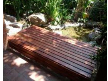
DECKS Y PLATAFORMAS

Para mejorar el aspecto, proteger y conservar la teca