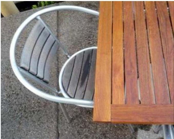
Después de usar el Kit en la mesa