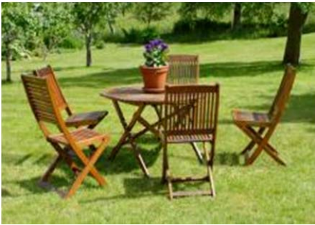
MUEBLES DE TECA