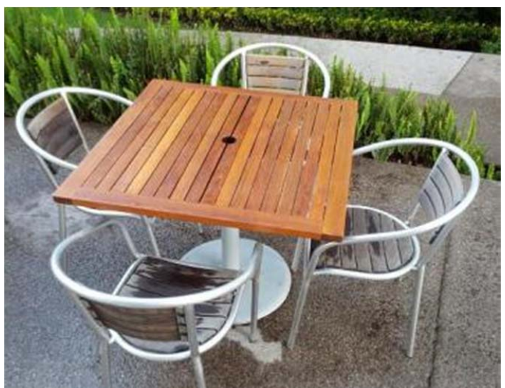
Después de usar el Kit en la mesa