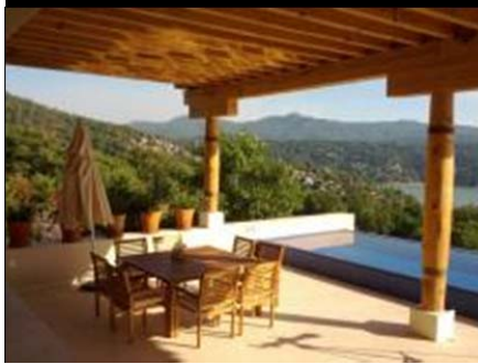
MADERA NO BARNIZADA