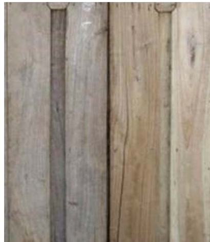
Sin lavar y lavada