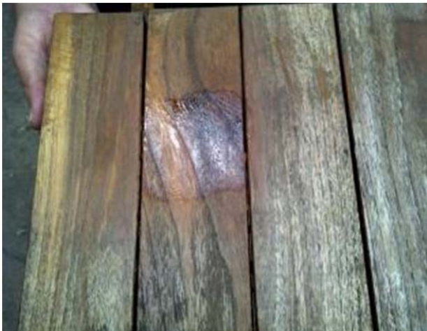
La esquina superior izquierda se lavo con el limpiador concentrado y se acaba de poner aceite para teca.

Deje secar completamente y evalúe si desea aplicar el abrillantador para aclarar la madera y restaurar su color original antes de aplicar el aceite para teca.