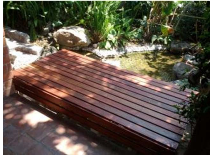
Después de usar el Kit